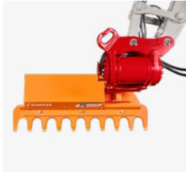
Heckenschere PG150 F