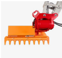
Heckenschere PG150 F