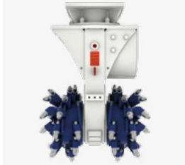
Erkat Fräse ER600-2