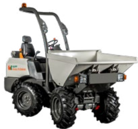
HUPPDump D120 AHA