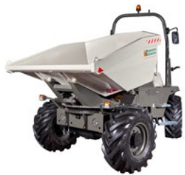
HUPPDump D601 APG