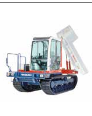
TCR50 mit Dreh-Kippmulde